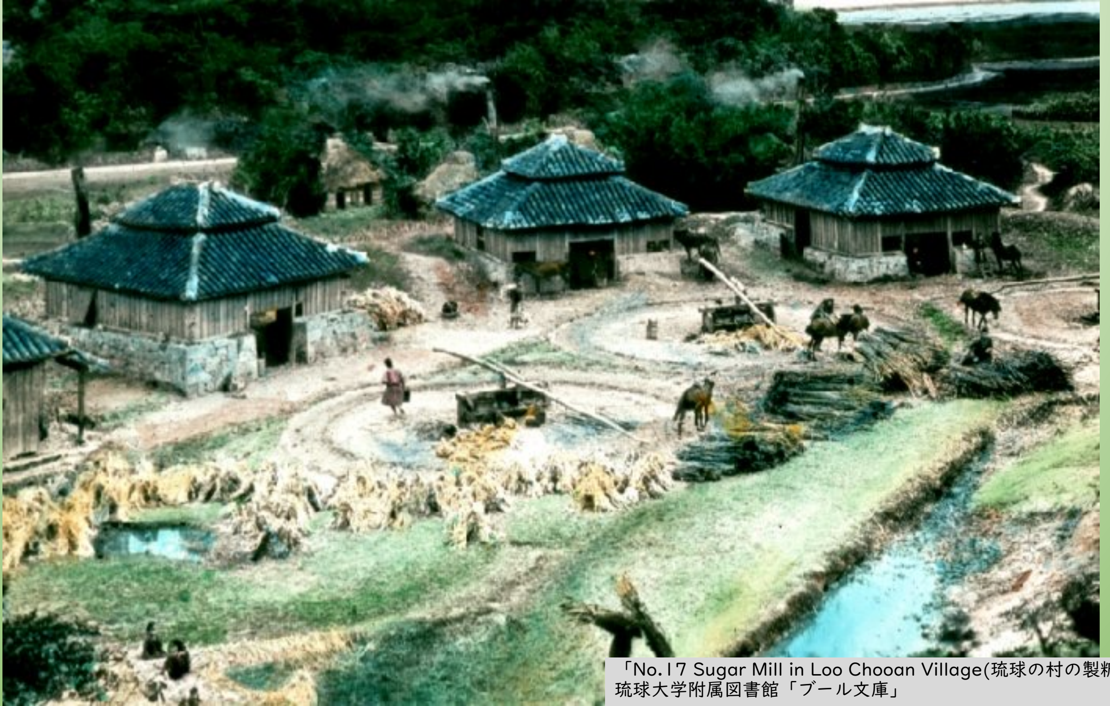
「No.17 Sugar Mill in Loo Chooan Village(琉球の村の製糖場)」